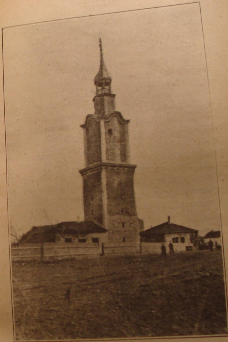
Biserica din Orhania.

După masă, înarmat cu două sticle în care fusese vin, eu m'am dus să aduc apă de la un izvor ce se spunea că țâșnește dintr'o stâncă, în