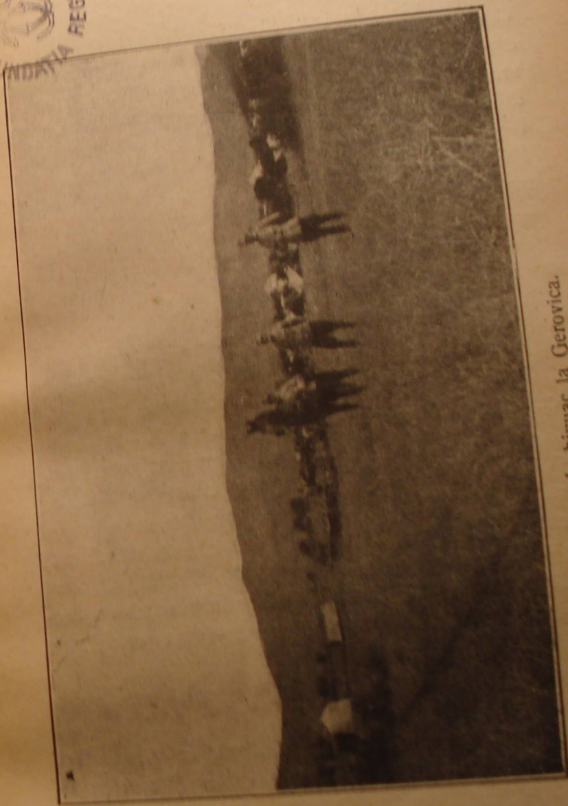
In bivuac la Gerovica.