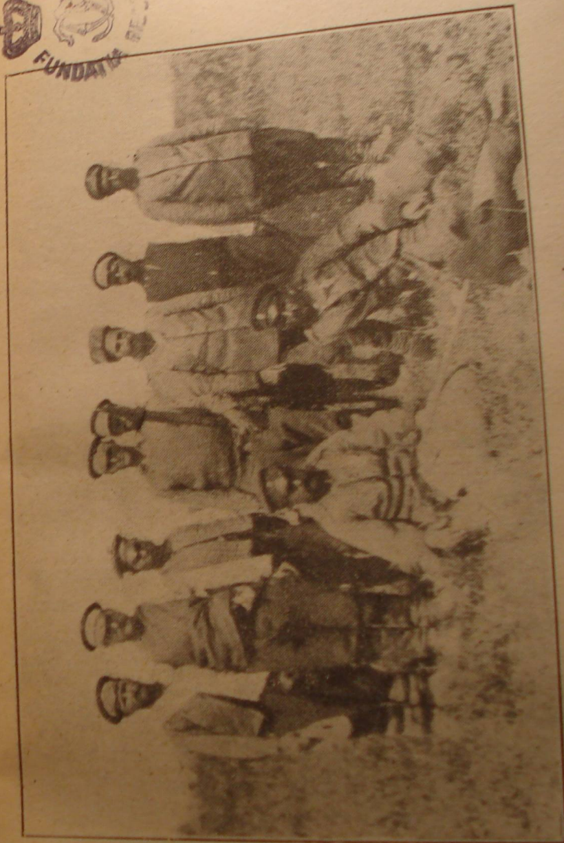
Un grup de prizonieri bulgari