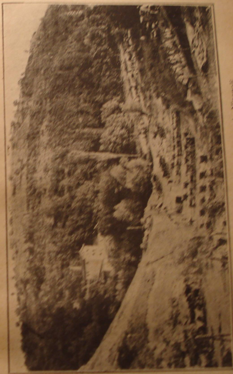
Divizionul I din reg. 14 artilerie în bivouac la Nicopol.

Ș'apoi, câte alte greutăți: mâncarea ce trebuia pregătită în puterea nopții; pâinea ce se distribuia oamenilor la lumina focurilor; ceaiurile ce se ferbiau înainte de a se zori de ziuă; încolnarea ce trebuia făcută la minutul și la secunda hotărâtă căci altfel se încurca tot marșul trupelor. De-abia porniți la un drum, se ridică grija popasului viitor. Și atunci toate greutățile odată învinse se iviau din nou.