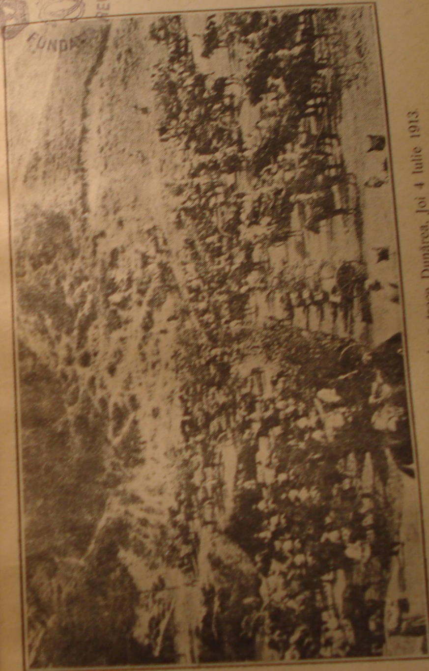
În portul Bechet, înainte de a trece Dunărea, Joi 4 Iulie 1913.