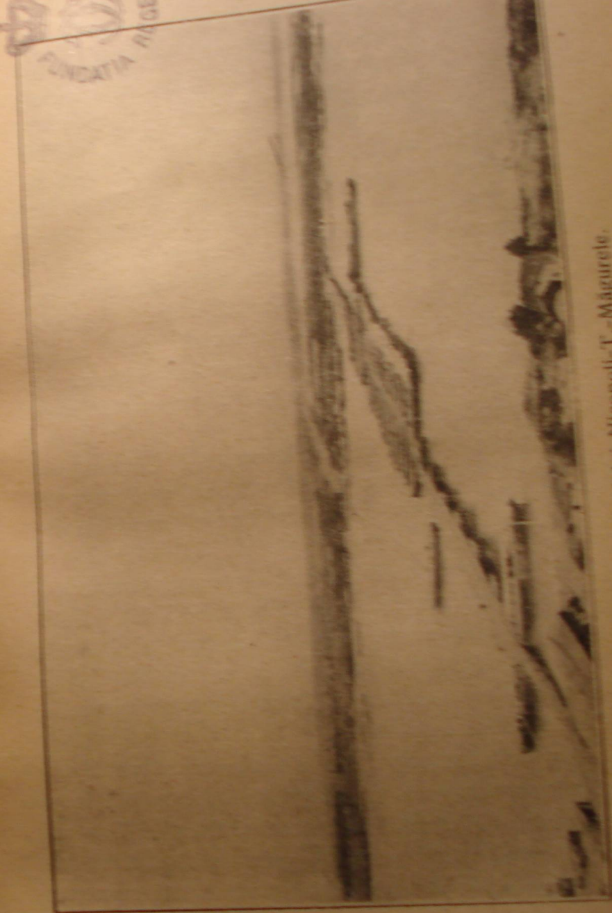
Vederea podului Nicopoli-V. Magurele.

După un marș de un ceas și jumătate, ajunserăm la botul unui deal, alcătuit din întâlnirea a două văi, în fundurile cărora gâlgăia câte-o apă curgătoare. Acolo poposirăm de nămiezi. Și tot acolo ne întâlnirăm și cu regimentul 9 de arti-