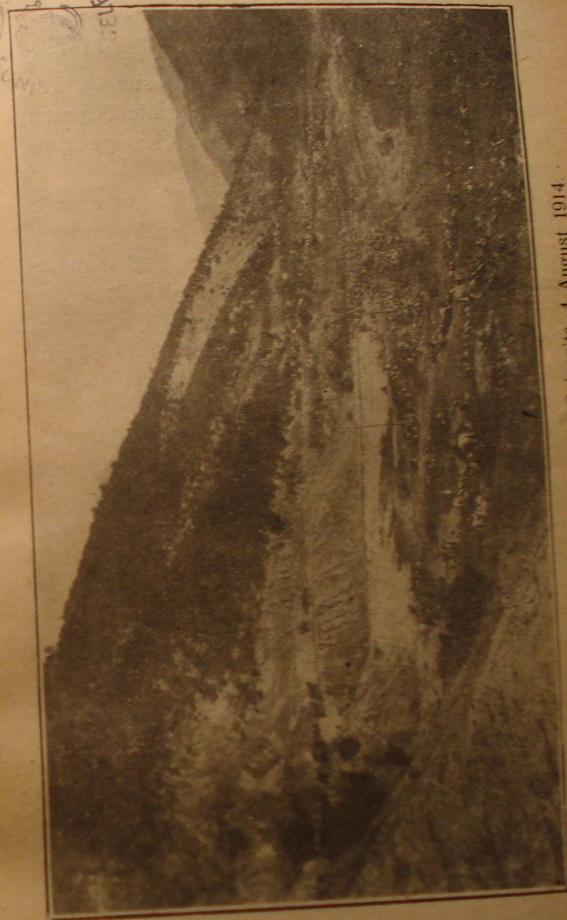
Trecerea prin defileul de lângă Osicevița, 4 August 1914