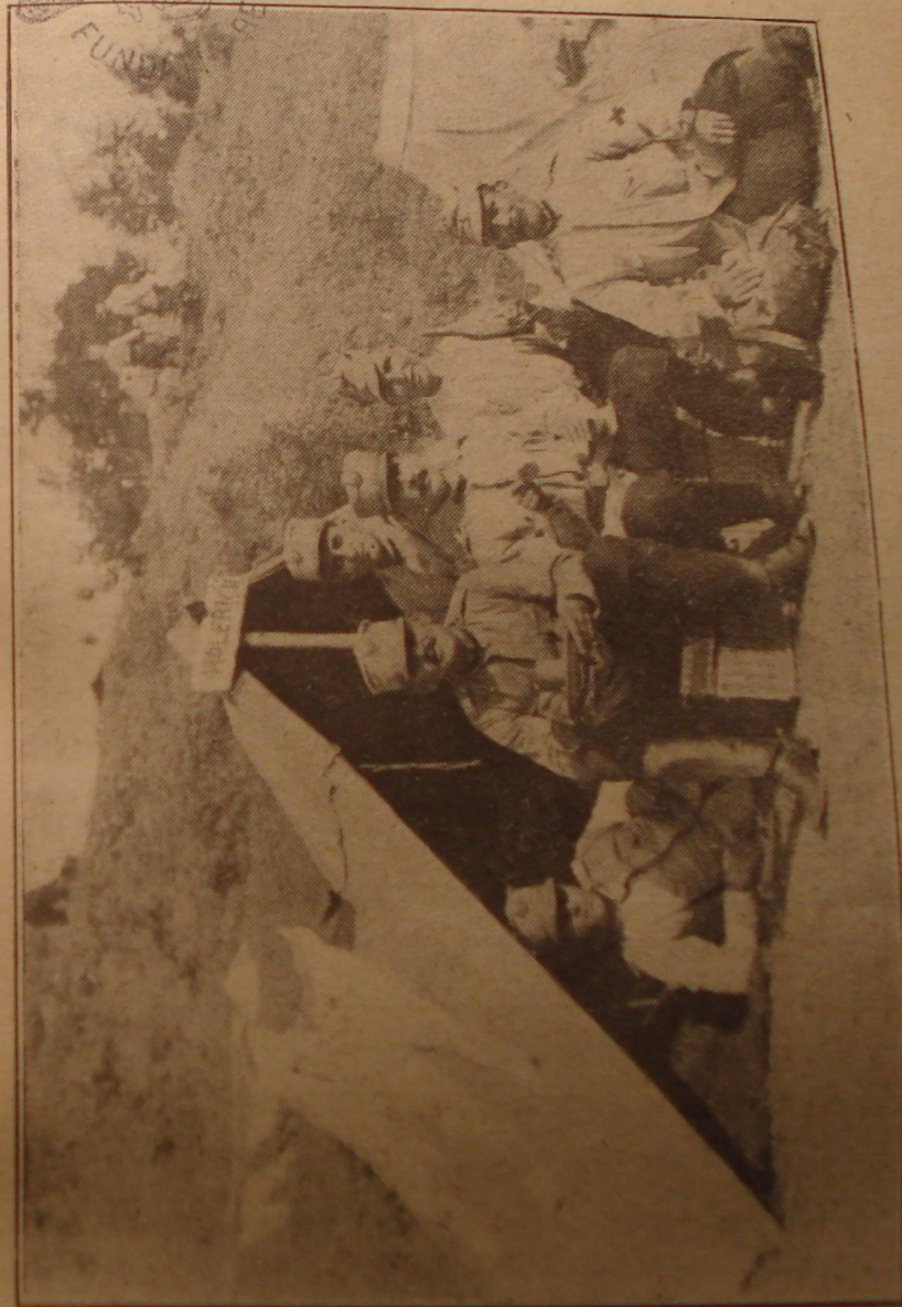
Un cort de holerici.