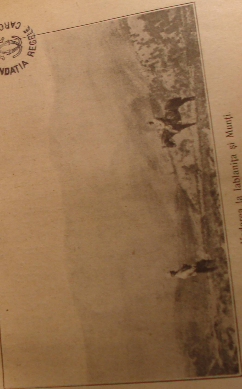
Vederea la Iablanita și Munți.