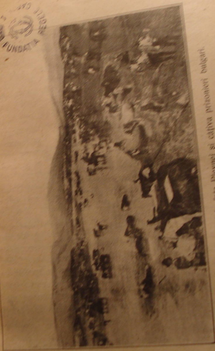
Vederea râului Vidin în fața Plevnei și câțiva prizonieri bulgari.