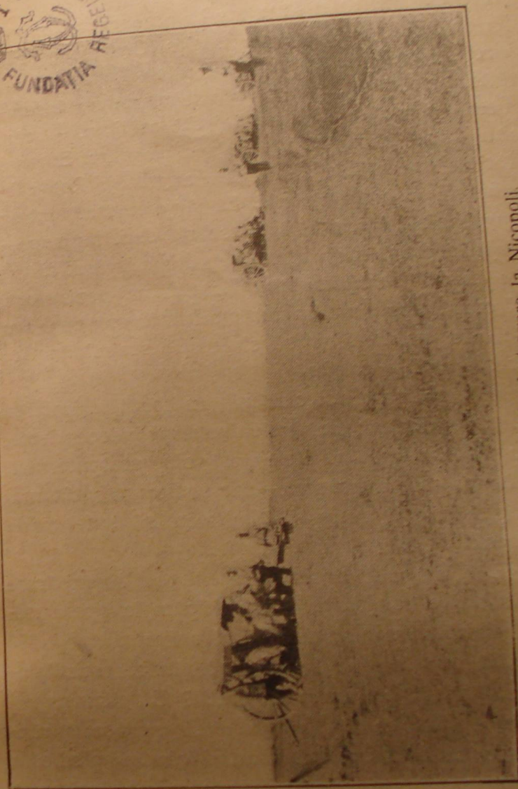
O baterie în poziție de tragere la Nicopoli.