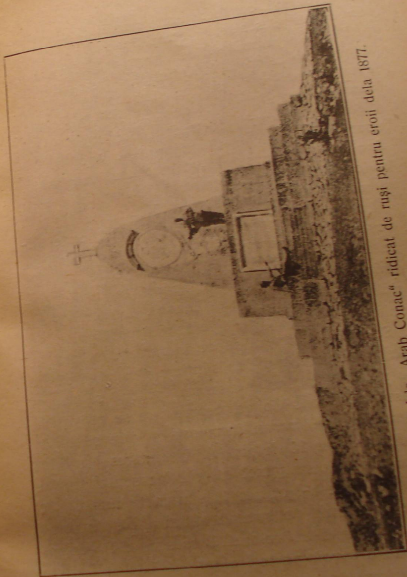
Monumentul dela „Arab Conac” ridicat de ruși pentru eroii dela 1877.