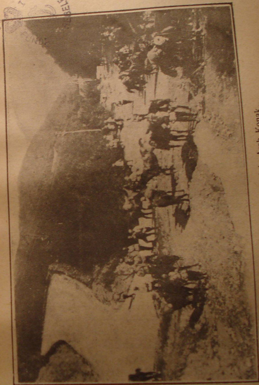
In defileu La poalele lui „Arab Konak”