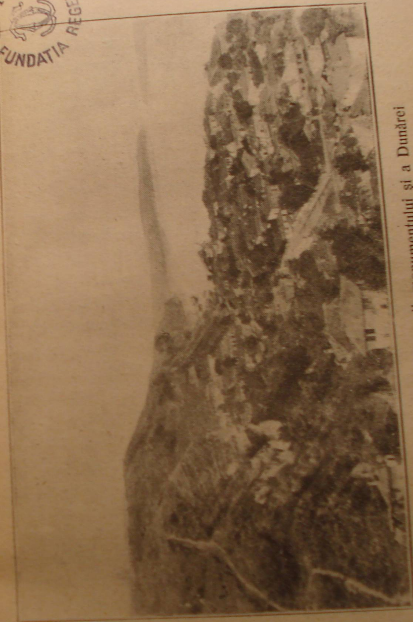
Vederea orașului Nicopoli, monumentului și a Dunării