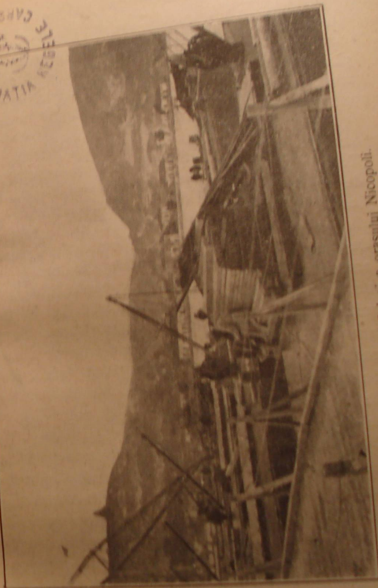
Vederea podului și a orașului Nicopoli.