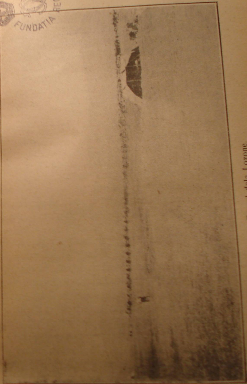
Parcul dela Lozone.